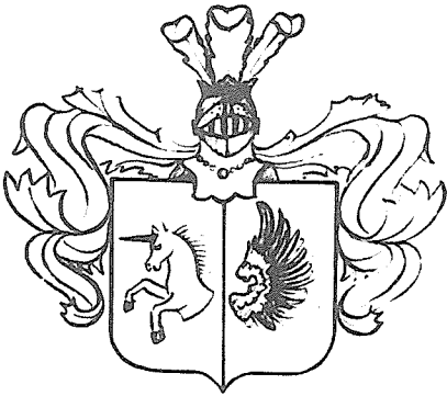
Obr. 3. K čl. 2.2.7.

však přesvědčení, že nebude málo heraldických badatelů, kteří toto řešení by nepřijali a kteří pro svůj badatelský bank se již alespoň pokusí uvést námět po své vlastní úpravě do své soukromé realizace, i když budou zatím znakové figury, lokální údaje aj. uvádět slovy. Je také možné, že obětavi členové GHS vypracují v předstihu (pro užitek kolektivu) některý z abecedních seznamů ve smyslu čl. 1.1.0.